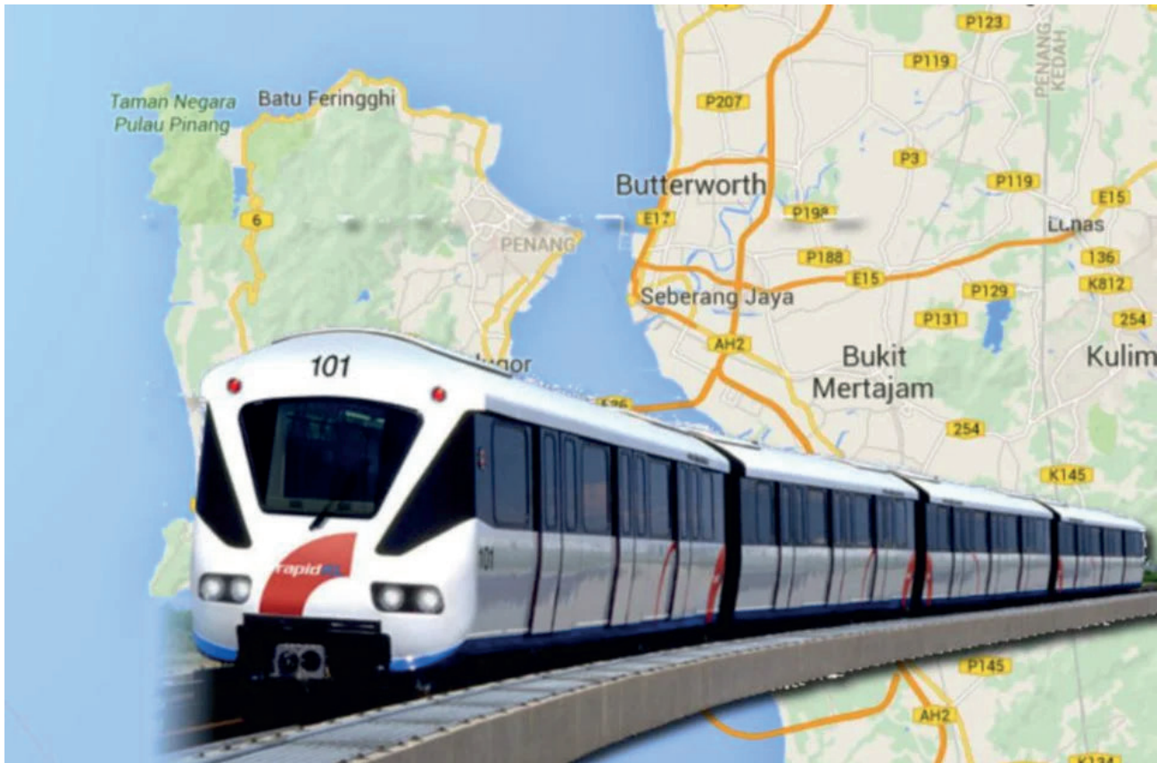
LRT Pulau Pinang sebahagian daripada projek mega domestik yang akan memulakan kerja pembinaan tidak lama lagi - Gambar hiasan